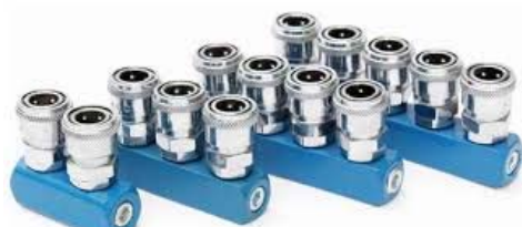
SML-2 SML-3 SML-4 SML-5