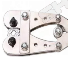
TL043 คีมย้ำหางปลา JY-25150 ราคา 7,440-