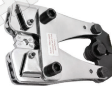
TL063 คีมย้ำหางปลา JY-70240 ราคา 7,200-